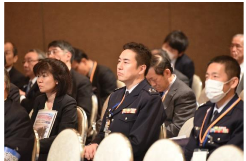
研究発表会場の様子

第3セッション「爆発・衝突」において、学会内に設置された技術部会の活動報告「衝突および爆発作用を受ける構造物の安全性に関する設計ガイドラインについて」では、別府万寿博氏（防衛大学校）が、防衛施設学会から発行された2つの設計ガイドラインは、衝突作用を受けるコンクリート構造物の局部破壊および爆発作用を受けるコンクリート構造物の安全性評価に関する技術書について解説したものであり、衝突作用による局部破壊および爆発作用に対するガイドラインとしては国内では初めて策定されたもので、このガイドラインが衝突および爆発災害に対する対策の一助となるものと考える旨報告した。