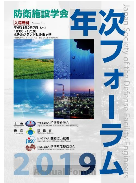
パンフレット表紙

防衛省をはじめ数々の団体の後援を得たことは、当学会の活動等が、公益性の高い団体・行事であると社会から認められた証左であり、今後の活動等に一層の弾みがついた。