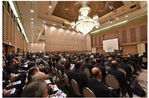
立見の出る満席の特別講演会場